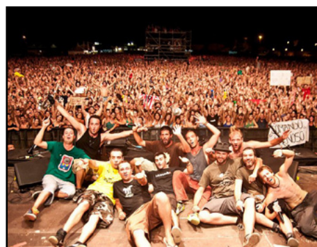
Arenal Sound 2011