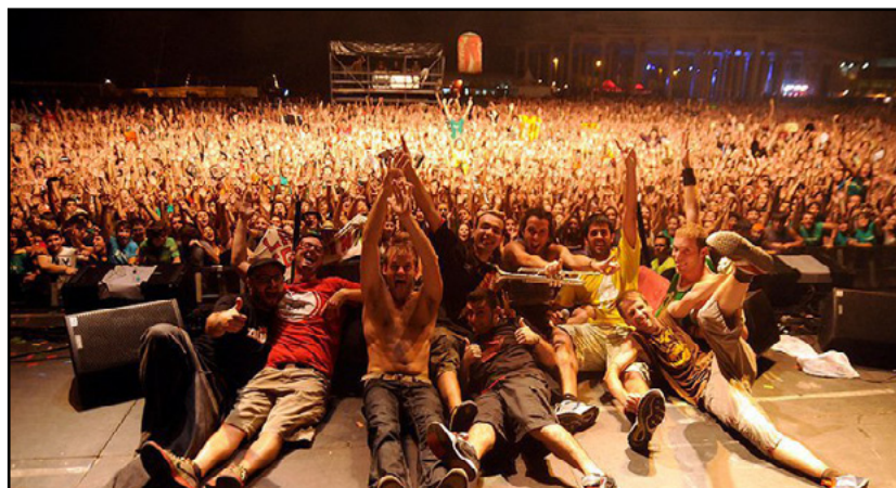
La Mercè (Barcelona, 2010)