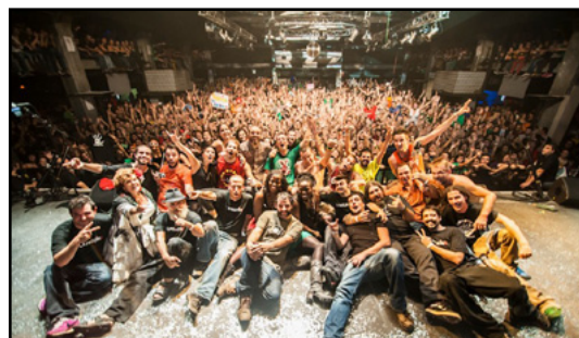
Razzmatazz (Barcelona, 2012)

La Pegatina du haut de ses dix ans reste un projet toujours débordant d'illusion, d'élégance et de fraîcheur. Un engouement, une maturité et une énergie toujours au rendez-vous, évidemment prêt à faire danser et sourire n'importe quel public. La Pegatina vous attend au coin de la rue!