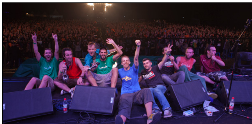
Xi'hu Festival 2011 (Hangzhou, China)