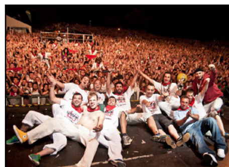
San Fermín 2011

Tournée espagnole avec 20 sold-out ViñaRock - Villarobledo (Espagne) Tournée en Equateur Night of Arts - Groningen (Hollande) Festival Mundial - Tilburg (Hollande) Festival Cruïlla Barcelona (Espagne) Acampada Jove - Montblanc (Espagne) Aúpa Lumbreiras - Villena (Espagne) Fêtes de Pau (France) Festival du Poupet (France) Semana Grande de Vitoria (Espagne) Festa di Radio Urto (Brescia, Italie) Ferrara Music Park (Ferrara, Italie) Festival Lowlands (Hollande) Mercat de Música Viva de Vic (Espagne) Pilares de Zaragoza (Espagne) Pilares de Fraga (Espagne) Razzmatazz, Barcelona (Espagne)