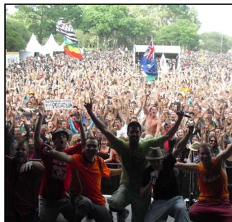
Le Bout du Monde, 2010